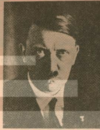
HİTLER VE HAYRANI TÜRKES

Yerli ve yabancı bankalardan, büyük sermaye sahiplerinden aldıkları paralarla silâhlanan faşistlerin «Bankalar millileştirilmelidir» sloganı sahtedir. Bankaların millileştirilmesi ancak emekçiden yana