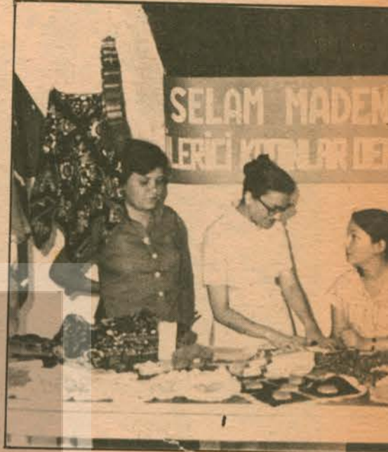
Ankara Çankaya Şubesi üyeleri demokrasi düzenlenmiş Maden-İş'le Dayanışma Gecesi'nde çiller yararına satış yaptılar. Ayrıca pazar ve

Ankara'daki, İzmir'deki, Balıkesir'deki, Antakya'daki, Trabzon'daki İKD üyeleri böyle diyorlar ve topladıkları para, erzak ve Maden-İş yararına satılmak üzere çeşitli eşyaları yolluyor-