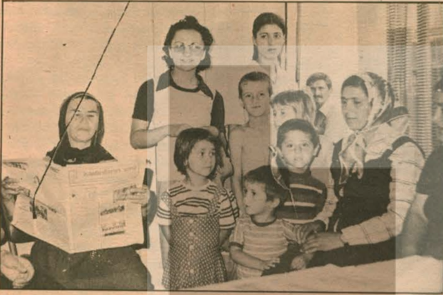
İKD İzmir Şubesindeki doktor üyeler de grevci işçileri desteklemek amacıyla Çamdibi semtinde yaptıkları poliklinik çalışmalarında para ve kuru yiyecek toplamışlardır.

Samandağ'ın umut ve yaşam dolu çilekeş kadınları da grevci eşleri gibi çeyiz sandıklarını açıp «Anadolu'nun güney ucundan grevci işçilere,