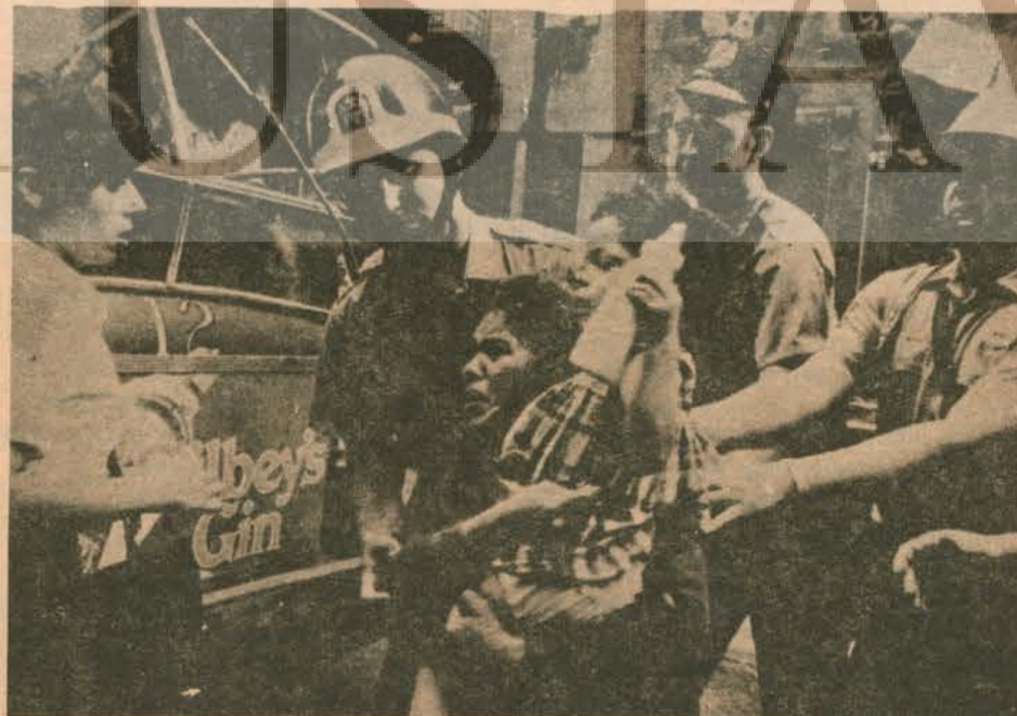
İşte ABD nin insan hakları savunuculuğuna bir örnek!