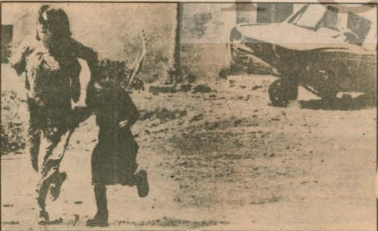
İsrail'in topçu ateşinden yavrusunu kaçırın bir ana.

ÇÜNKÜ ARTIK EMPERYALİZMCAN ÇEKİŞMEKTEDİR.