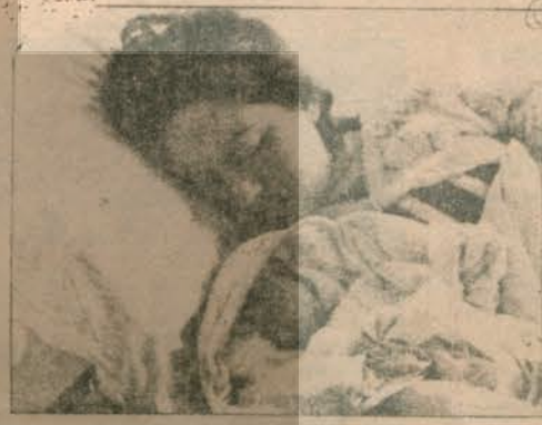
Yaşamaz diye ölüme terk edilmesine rağmen uzun müddet yaşayan bebek öldükten sonra annesinin yanında görüyor.

inanmadılar. Bu yüzden doğum öncesi iznimi 20 gün az kullandım. İKD'nin bu konudaki kampanyasını destekliyor ve doğum izinlerinin birleştirilerek 6 aya çıkarılmasını bekliyoruz.