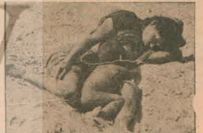
Kuraklık, sosyal sarsıntılar, dünya nüfusunun dörtte üçünü açlık felaketine sürüklemiştir...

GELİŞMİŞ ÜLKELER, ACİL DURUMLAR İÇİN 500 MİLYON TON TAHLİ DEPOLAYACAK