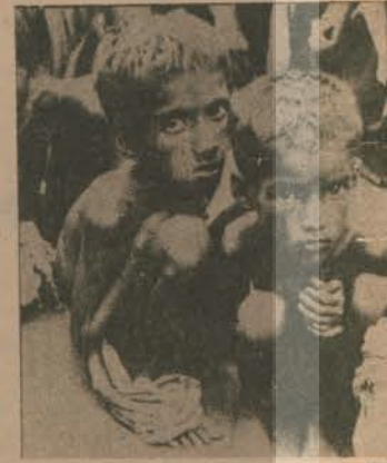
ÖLÜME BEKLEYEN İKİ AC...

Dünya Beslenme Kongresi Filipinler'de toplandı