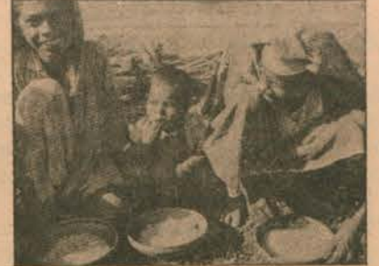
BM'nin sağladığı bulamacı, milyonlarca insana ancak tek öğün olabilmektedir.