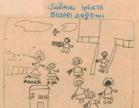
OYA GÖNEN 1.sınıf

Yine ilkokul 1. sınıfta okuyan ve annesiyle birlikte bildiri dağıtmaya gitmiş Oya Gönen yaşadığı günü çizerek göndermiş.