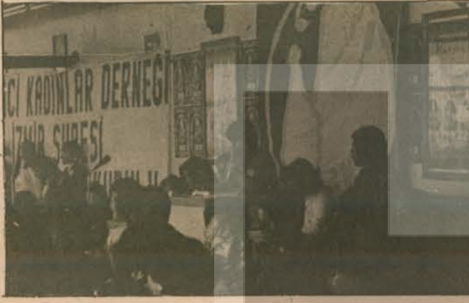
• İzmir Şubesi 2. Genel Kurulu

Fatih Şubesi Öğrenci Komisyonu çok sayıda anneye çağrı yaparak şube lokalinde anneler gününü kutlamıştır.