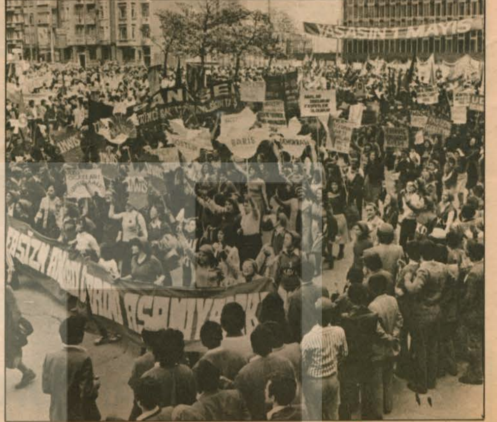
1 Mayıs 1979'da daha da güçlü olacağız