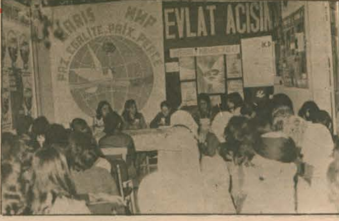
• Mersin Şubesi Genel Kurulu