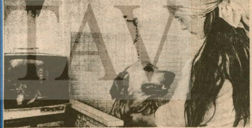
Kanadeli talihli zengin köpeğin, katığı otele TV'li odasında, otele görevlisince banyo alırken.

Köpekler TV'de çizgi filmlerden çok hoşlanıyorlar