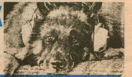
"Karabağ" adlı bu zengin köpeğin, otele en çok sevdiği şey, "Stereofonik kuzaklıkta" klasik müzik dinlemektir.

Köpekler TV'de çizgi filmlerden çok hoşlanıyorlar