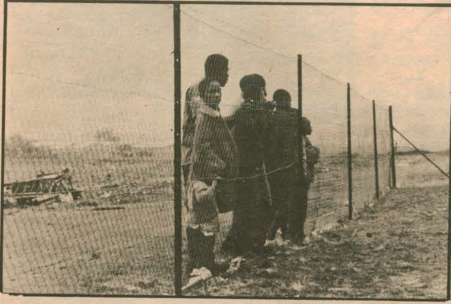
Siyahderili insanlar telörgülerin arkasından bakıyorlar özgürlüğe ve eşitliğe... Bir dokunsalar yıkılacak o duvarlar. Evet dokunuyorlar ve yıkıyorlar duvarları, yürüyorlar aydınlığa doğru...