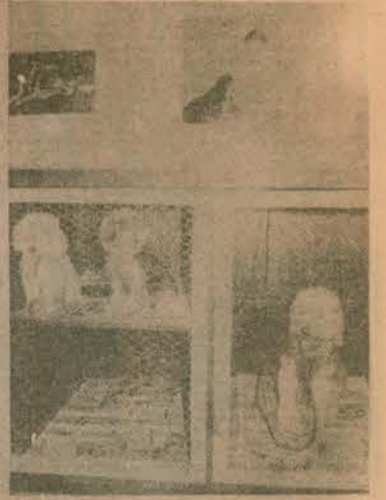
'Köpek Hotelinde bir gecelik 'komple pansiyon' ücreti 300 lira. Fotoğraf: sahnelerim, İsvan'dan getirilen, evde bulunan başa-ya 3 saatte buca getirildi.