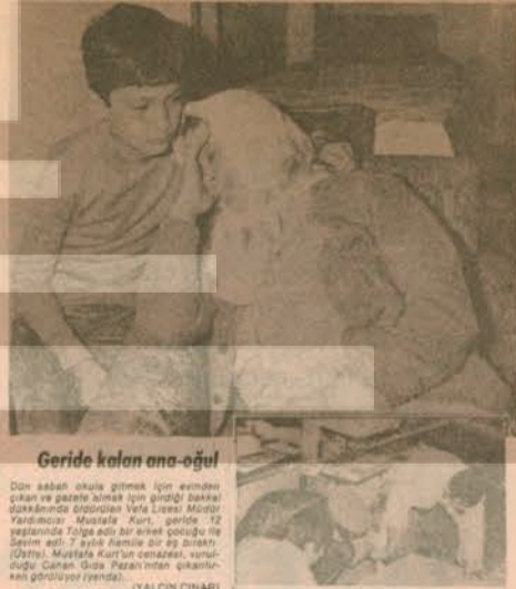
Geride kalan ana-oğul

Yılbaşından bu yana Türkiye'de meydana gelen anarşik olaylar, alınan çeşitli önlemlere rağmen azalmayıp aynı hızla devam ediyor. Yapılan resmi açıklamalara göre, yılbaşından bu yana 452 kişi öldü. Sadece içinde bulunduğumuz eylül ayının 24 gününde meydana gelen anarşik olaylarda ise ölenlerin sayısı 48'e ulaştı.