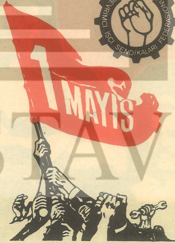
İŞÇİ SINIFININ BİRLİK DAYANIŞMA VE MÜCADELE GÜNÜ

1 MAYIS MARŞI Günlerin bugün getirdiği Baskı zulüm ve kandır Ancak bu böyle gitmez Sömürü devam etmez Yeppyeni bir güneş doğar Bizde ve ülkelerde 1 Mayıs 1 Mayıs İşçinin emekçinin bayramı Devrimin şanlı yolunda İlerleyen halkın bayramı Yeppyeni bir güneş doğar Dağların doruklarından Mutlu bir hayat filizlenir Kavganın ufuklarından Yurdumun mutlu günleri Mutlak gelen gündedir 1 Mayıs 1 Mayıs İşçinin emekçinin bayramı Devrimin şanlı yolunda İlerleyen halkın bayramı