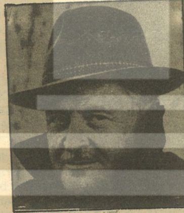
İŞÇİ SINIFININ SAVAŞKAN OZANI NAZİM HİKMET

Böylece Devrimci sanatçılar kendilerini geçmişin yoz bağlarından kurtarıp gelecek mutlu düzen için ürün vermekteler. Ve bu şekilde kitlelere bilinç götürerek sermayeyi devirmek üzere doludizgin bir mücadeleye giren proleter ya ve emekçi halk saflarına omuz vermekteler. Yukarıda anlatılanların