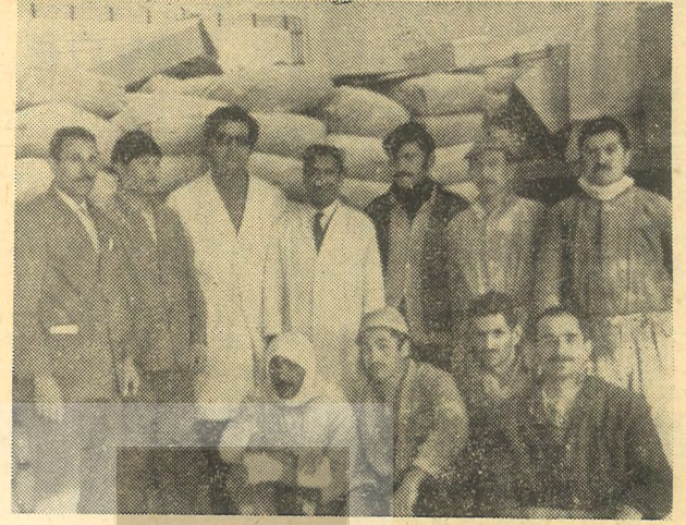
LİLİ'Lİ DEVRİMCİ İŞÇİLER

Adana'lı toprak ağaları heyetin masraflarını karşılamak üzere aralarından 5000'er lira toplamışlardır.