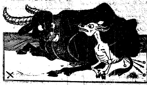
خلق فرانسسیک دامانیسی ایچی چایسی آیتله عملو فرانسسیک حال

اوراق چکیچ الکابی بر عملو کویو غزنیسی در . ایشیلرک بوز غزنیسی در . اونک هر ایزانی ، هر سوزی ایشیلرک حال ، ایشیلرک کیندر . بونکچون هر عملو کویو بر کیدی غزنی لریته . ایچون اولانرک اوراق چکیچ ، ایدیکه مکتوبلایمدر . هر عمل و کویو اوراق چکیچ غزنیسی نه ک اوبون بره سسی ، یازمیسی و خیرسی سیدر . ایشیلرک عملو و قیر کویو لره . ایچون چکیچ