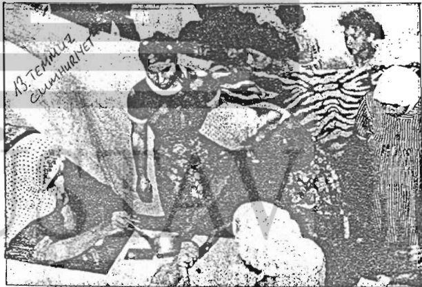
HANDAN SON KEZ YIKANIYOR