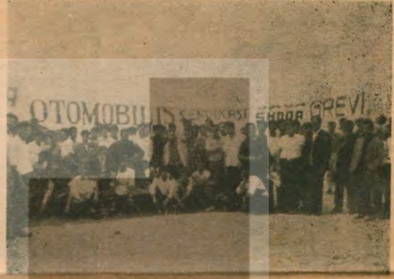
Birleşen işçiler grevde

İşsizlik gün geçtikçe artıyor. Böyle bir zamanda iş güvenliği işçilerimiz için hayati bir meseledir ve işlerini güvenlik altına alabilmek için BÜTÜN İŞ KOLLARINDA savaşlar vermek zorundadırlar. Bütün emeğiyle geçinenler için olduğu gibi, işçilerimizin de yarınları güvenlik altında değildir. Ve yarınlarını güvenlik altına alabilmek için mücadele etmeleri en tabii haklarıdır. Mücadelemizin başarıya ulaşması, işçiler, köylüler, bütün emekçiler bir olup, birbirimizle kenetlenerek, örgütlenerek mücadele vermeye bağlıdır. Bu mücadelemiz, Türkiye'nin her yerinde bir meşale gibi yanmalıdır. Bu meşalenin adı DEVİRİM 'dir.