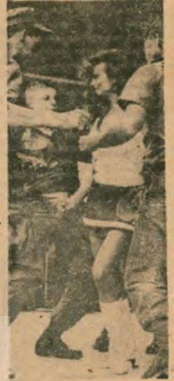
Vietnam'da garılarla eğlenirken iyi miydi?..

Danimarka Thule üssünü Amerika'ya kiralamayı 1951 tarihli anlaşmanın da tadilini isteyecektir.