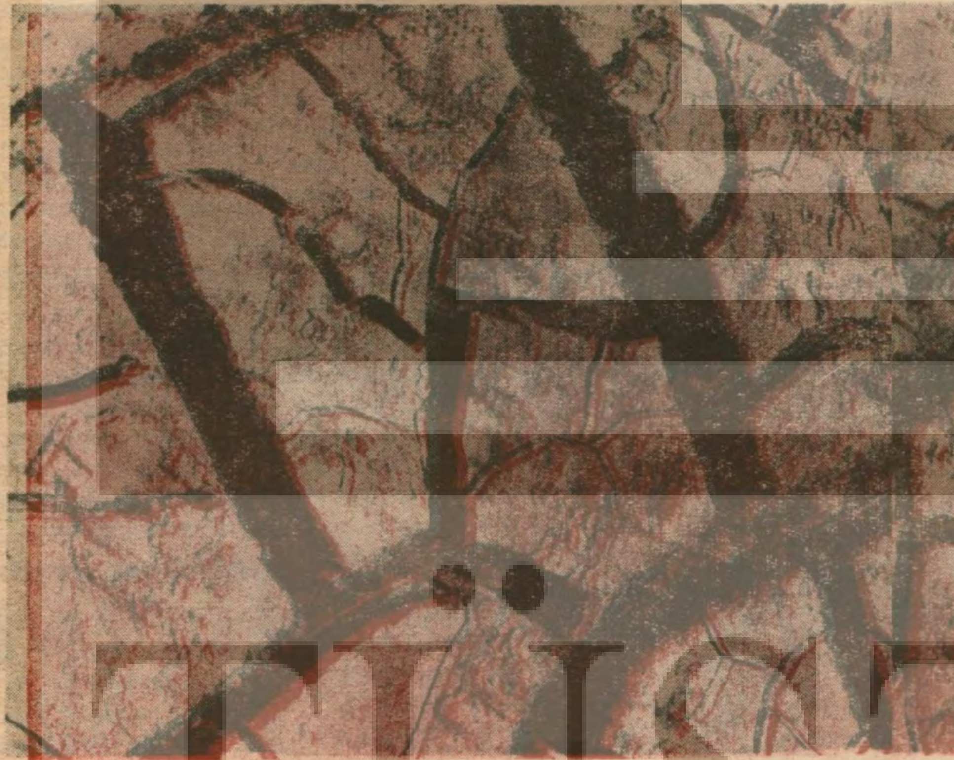
Kim şeneltebilir bu toprağı proleterden gayrı?

Biz, sömürüye karşı Anayasamıza emrettiği sosyal adaleti istiyoruz. Haklı biziz..