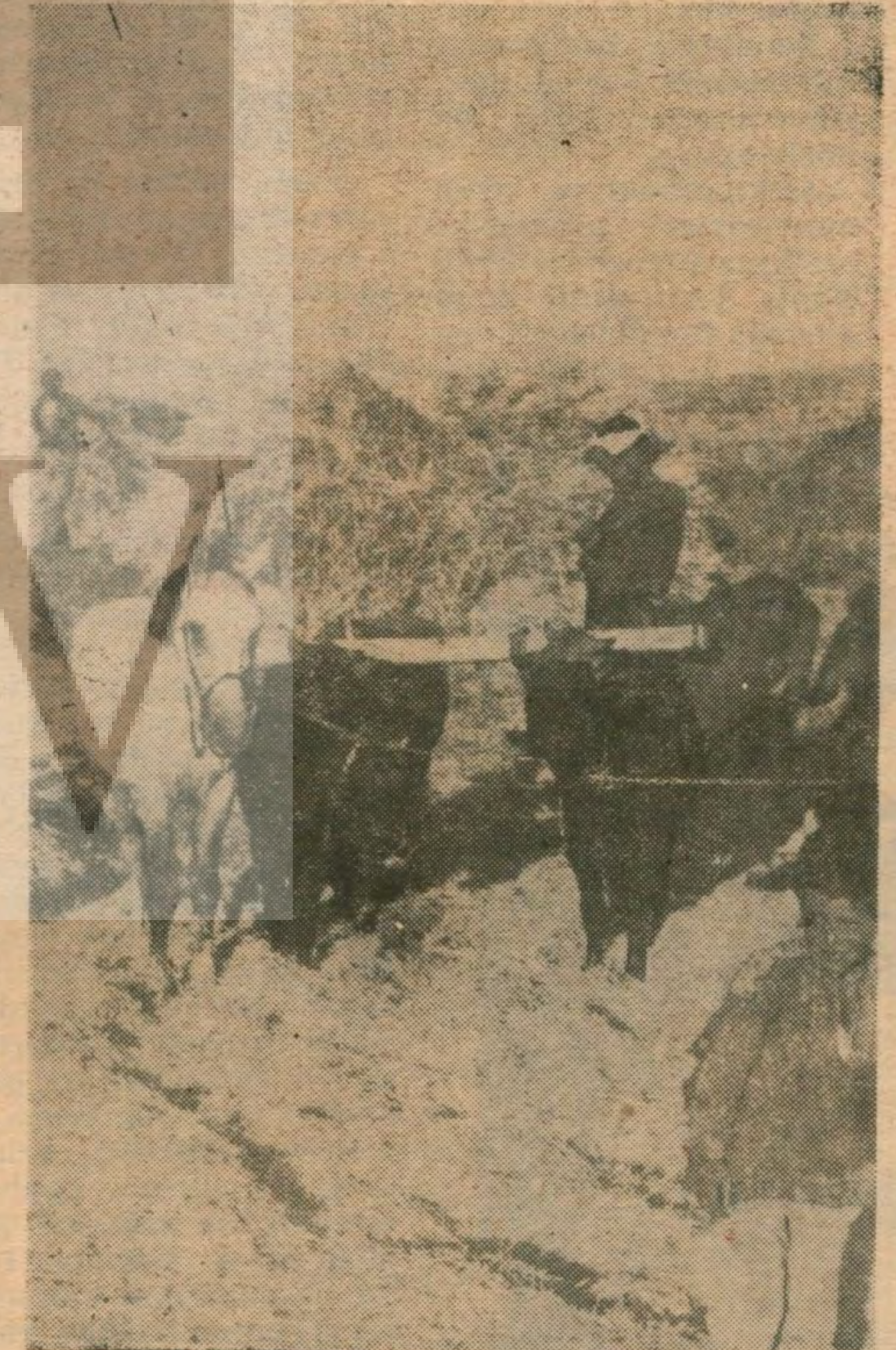
Baba, oğul, hayvanları, araçları ile güneş altında ağanın kesesine çalışıyorlar