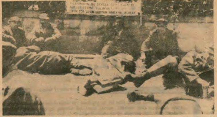
«Kısa çöp uzundan hakkın alacak..»