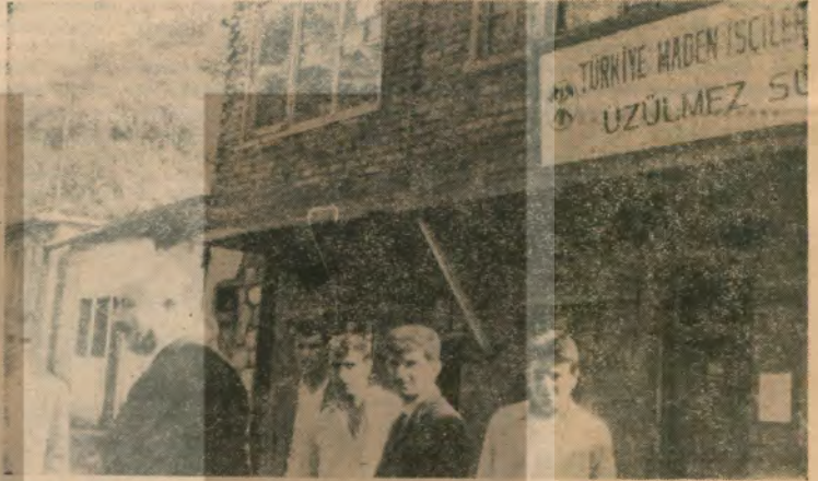
24 bin üyesi olan sendika dururken 1.337 üyelik sendika ile toplu sözleşmeye oturan:

Mucur ilçesinin Aydoğmus köyünde, hazineye ait toprakları dağıtmakta olan toprak tevzi komisyonu, toprak alabilmek için evli olmayı da şart koşması üzerine köylü gençler yıldırım nikâhı ile evlenmeye başlamışlardır..