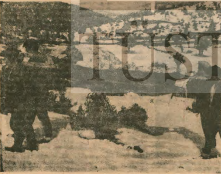
Kar hastırınca hastaların nasıl işleyecekleri, şu kurtaran zenginlerin yanında işçiler