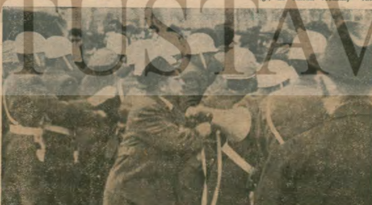
Gençlik NATO'ya «Defol be!» diyor — Ankara'da Amerikan aleyhleri gösterilerden biri —

Öte yandan Fikir Klübeleri ve Disk tarafından dün Kemeraltında, Türkiye'nin NATO'dan ayrılması istiyen bildiriler dağıtılmıştır.