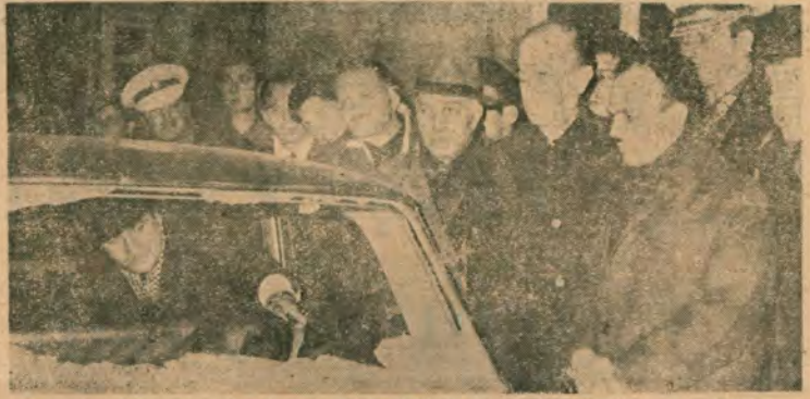
Gangster İrfan Vural'ın içinde öldürüldüğü otomobili ilgililer incelerken...