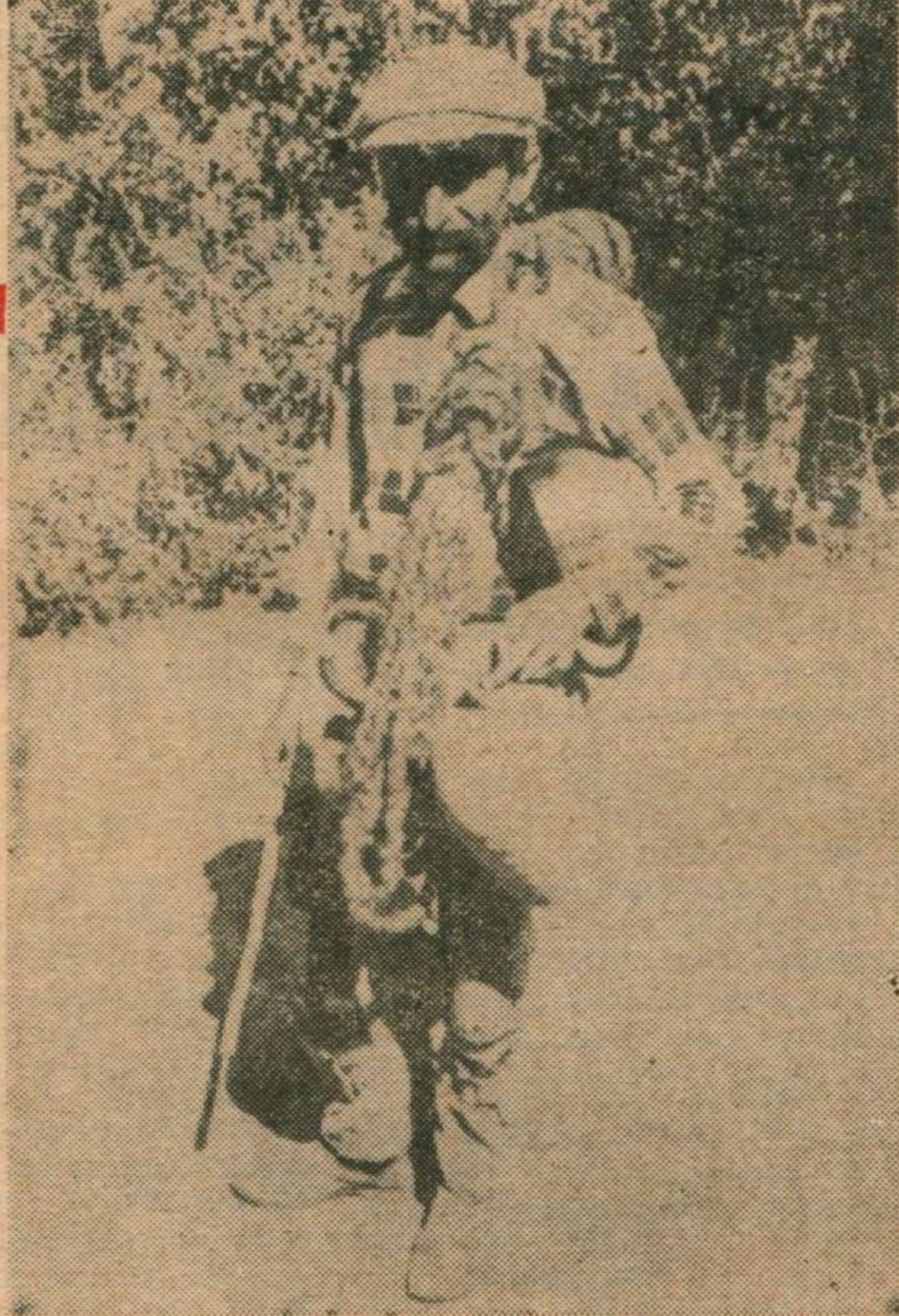
Yeygisi, geygisi, evi, yani her şeyi kendi üzerinde bir proleter