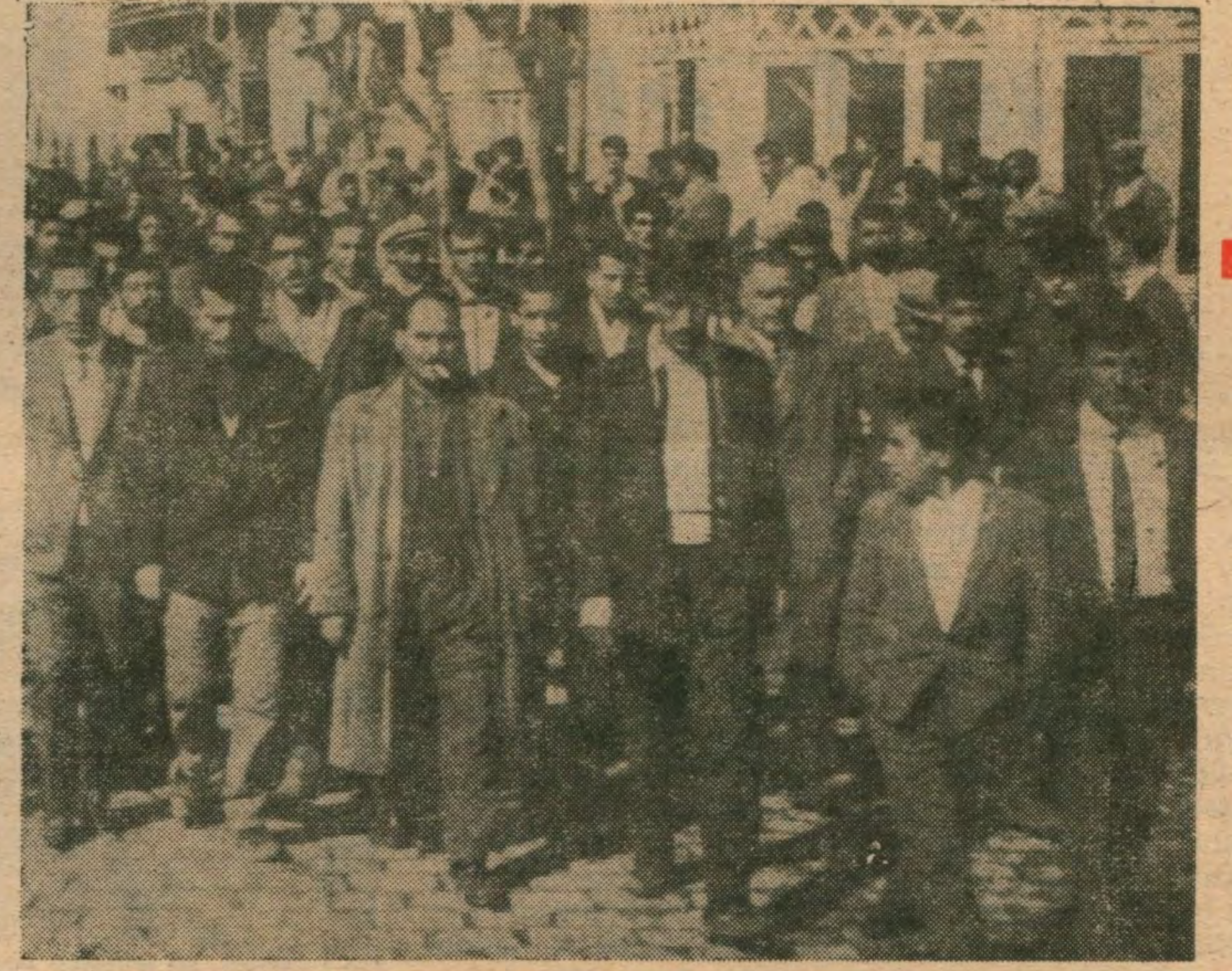
Cephan'da toprak reformu iste yeni proleterlerin yürüyüşü

TİP, Meclis Başkanlığına bu gensoru önergesi veriyor. Diyor ki: «Hükûmet Anayasamıza emrettiği toprak reformunu yapmamaktadır. Bundan dolayı sorumludur. Sulçudur. Bunu konuşalım, suçlu olduğu