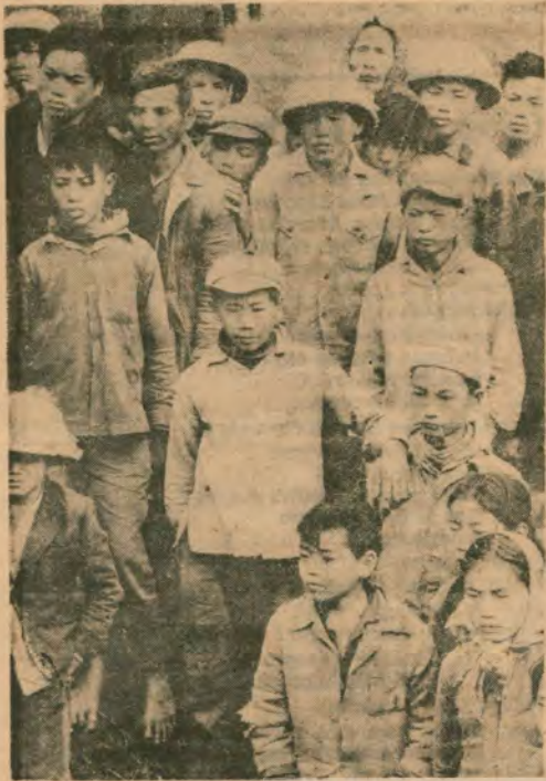
Vietnam'da çocuklar bile Amerikan emperyalistlerine karşı yurtlarının savunmasına katılıyor..