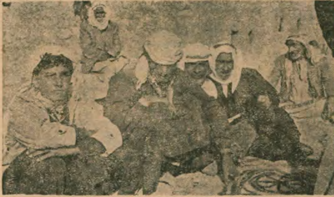
Zavot ağalarına süt, kaymak — Bize ağlamak.. ağlamak...