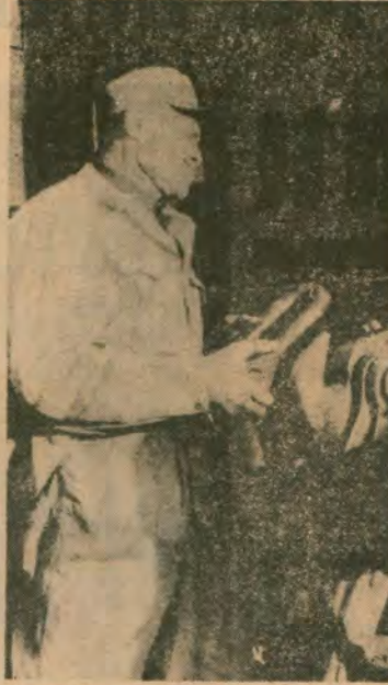
Biz yaratahm, siz milyon olun mahallemizde ha?