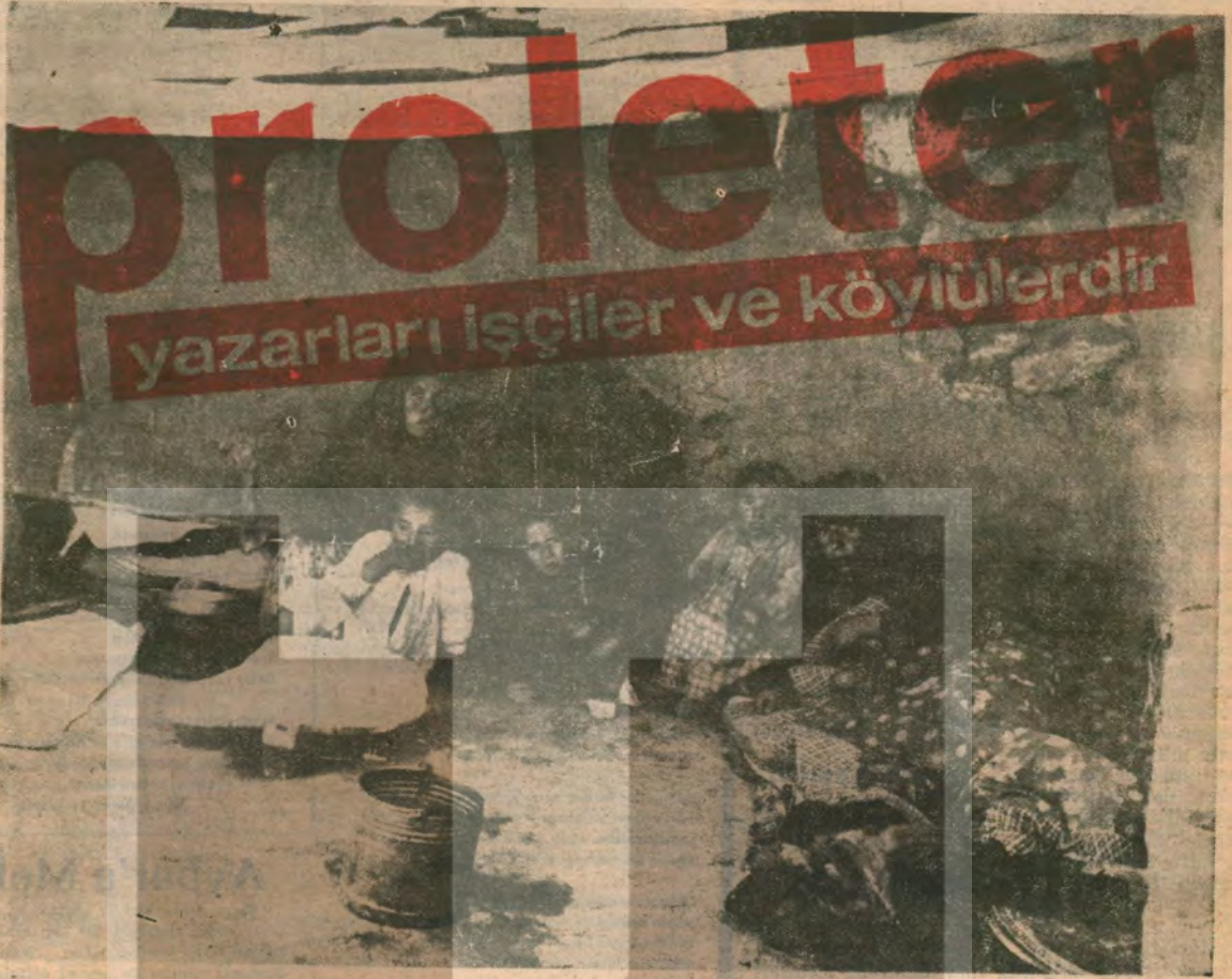
Elbistan'ın Akdül köyünden

Dönersek kahpeyiz halk için, halk için, Anayasa için savaştan