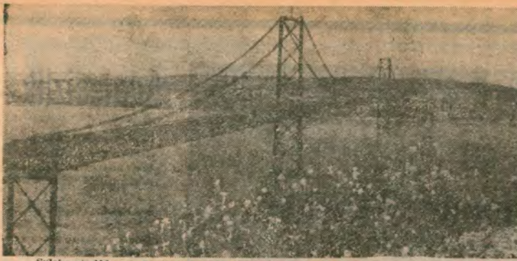
Sulakyurt, Akkuzulu köyünde proleterlerin eliyle yaptığı köprünün temeli.