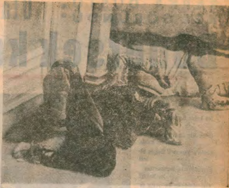
Evirip - çevirerek soyduğunuz emekçi, işçi, köylü,üm ben. Ben proleterim...