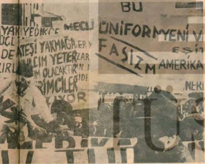
SA MITİNİNDE YÜRÜY EN ÖĞRENCİLER VE PROLETERLER için, Anayasa için savuştan —