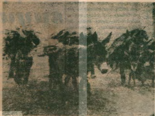
Anam bekler furunun kapusunu Ağalar ekler ekler mülk tapusunu..