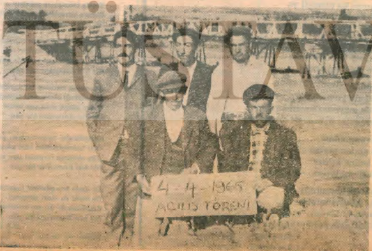
Süleyman bey İstanbul'a böyle köprü yapacakmış..

SABRİ DURAN — Kayaköy: Türkiyede yapılan sosyal hizmetler hâlâ planlı devreye girmemiştir. E-sasında daha mühim bir ihtiyaç varken bu ihtiyaçlar bırakılarak İstanbul asma köprü yapılması Türkiyenin sağılması ve İstanbulun emmesi babında girer.