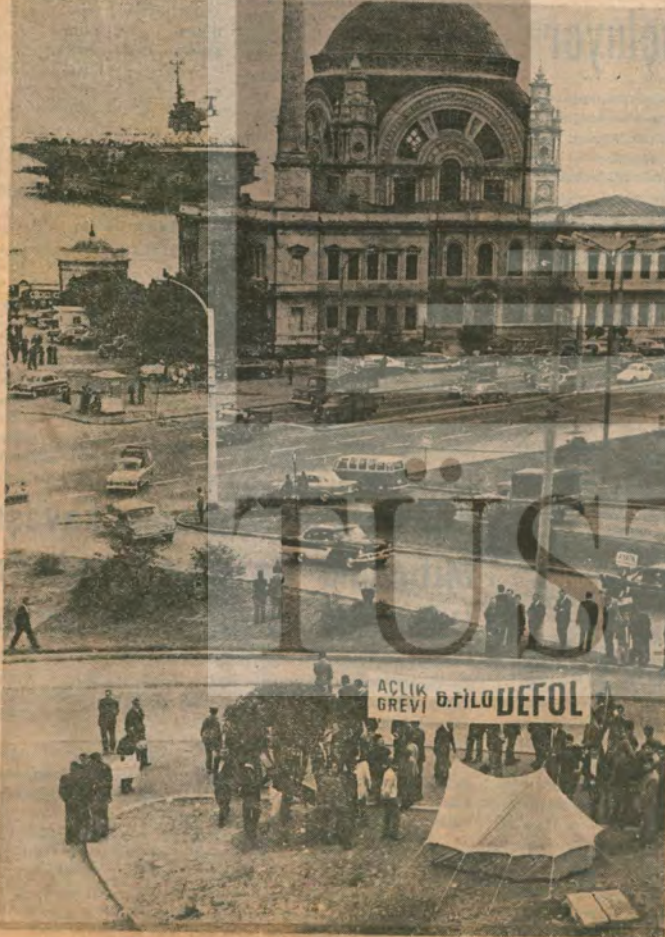
Karalarımızdan da, havalarımızdan da, deniz terimizden de defol! Defol! Defol be!