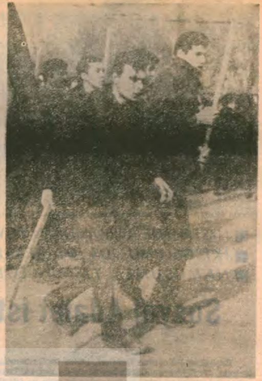
ANKARA UYANIŞ MİTINGİNDE ÜSTÜNE VARILAN TOPLUM-CULAR —Ne dek üstümüze varırsanız, bir, yüz misli şahlanırsınız!..—

ANKARA SENDİKA 15 günde bir çıkar Fikir ve Sanat Dergisi. Türkiye Maden — Madeni Eşya ve Makine Sanayi İşçileri Sendikası Yönetim yeri : Hürriyet Caddesi No: 86 — Maden İş Sendikası Karabük