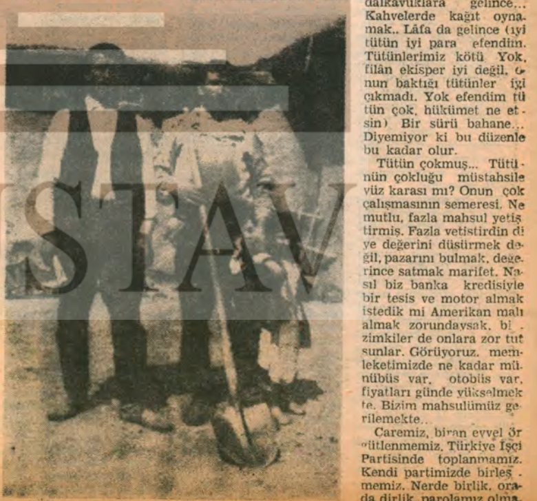
İste günün bedelini. Bir sosyal adalet istiyorum. Ben o konuşma da; Türkiye İşçi Partisi'nde sosyal adalet istiyorum. Benim sözlerim bu

TİP. sana gerçek demokrasiyi getirecek. TİP. sana insana yaşamayı getirecek, seni insan gibi yaşatacaktır.