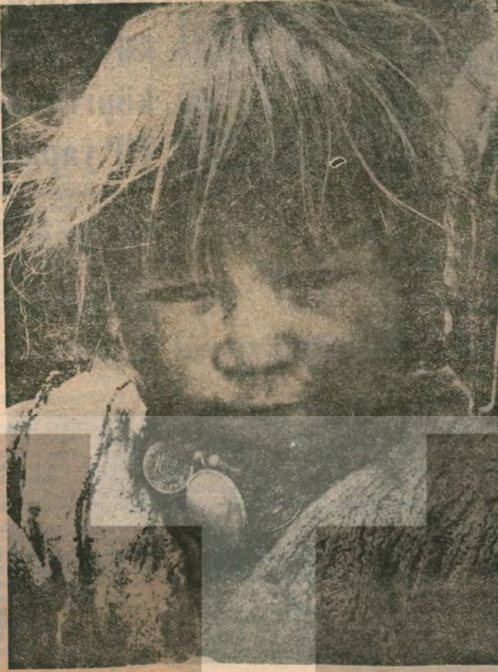
Hani biliyor musun kızım sen daha doğmamıştın Nazım Hikmet'in Kerem Gibisi'ni okumamıştın.

Ey hakkın çarkı!... Durmadan döneceksin. Seni durdurmak mı?... bu olamaz işte.. Değil el uzatma, düşün- neni bile, Taktığın gibi bir yerin- den dişine. Çalacaksın yere, vura- caksın, ezeceksin. Ey hakkın başı!... Durmadan döneceksin. Sana güç veren kuvvet. Değildir, soyguncunun, kapital st'in Hak arayan, hakka eden hizmet, Nasırlı elidir PROLE- TER'in. Ey hakkın başı!... Filizlenip büyüyeceksin. Seni kurutmak mı?... bu olmaz işte... Değil el uzatma, dü- şünenin bile, Boşa gidecek; hainliği, rezilliği, hepsi nafile, Bire karşı bin verip, büyüyüp geliyeceksin. Ey hakkın başı!... Filizlenip büyüyeceksin. Varoluşuna sebep olan kuvvet, Değildir, inkâr etmişin, kad'ini bilmiyenin Eken, biçen seni derle- yen buket, buket Nasırlı elidir PROLE- TER'in. İSMAİL GÜLDAL (Sultanhisar Bakkal)