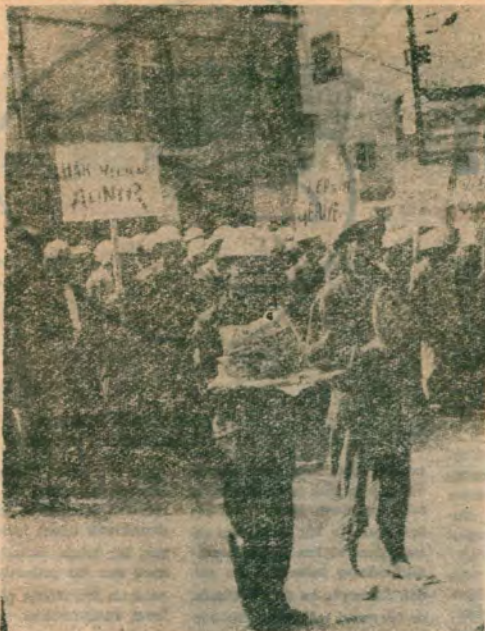
Elleri ve yüzleri kara, yürekleri ak kömür işçisi döküldü sokaklara..