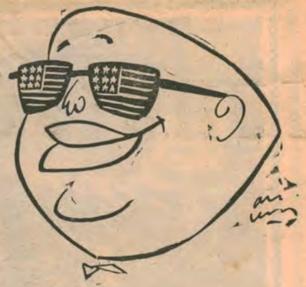
SÜLEYMAN DEMİREL — Şapka düştü, kel göründü —