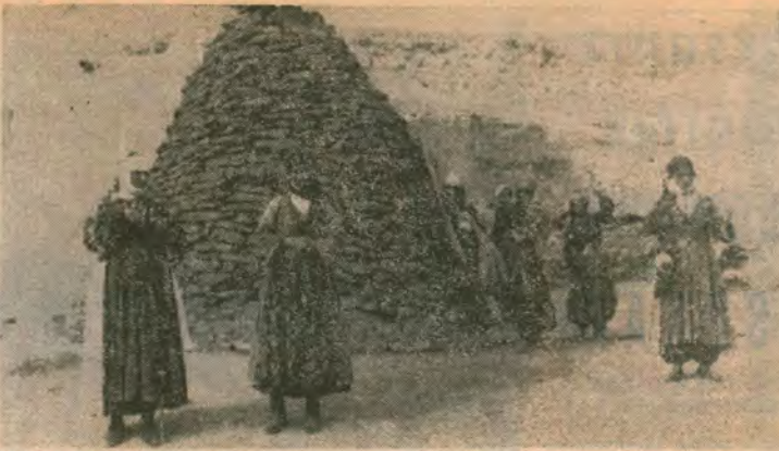
VANLI PROLETERLER : 1922'de yoktan var olmmuşuz.. 1968'de vardan yok olmak üzereyiz..