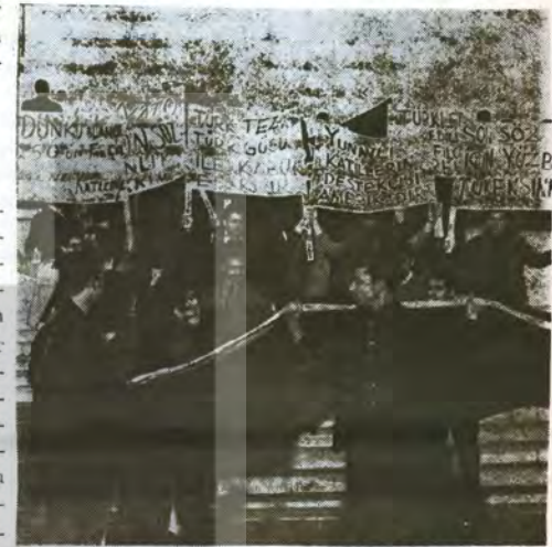
«TÜRKÜN DEDİĞİ, TÜRKÜN GÜCÜ İLE KABUL ET- TİRİLİR. — Ankara'da Kıbrıs politikasına karşı NATO' nun davranışını protesto mitinginde gençler.