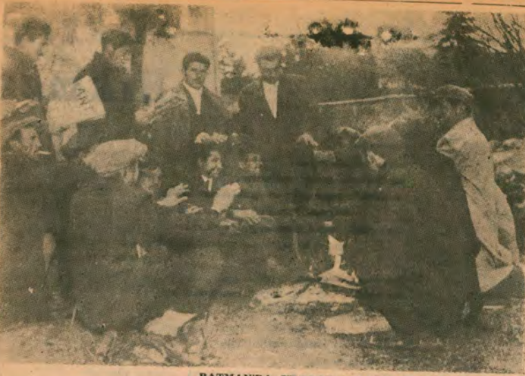
BATMAN'DA UYANAN PETROL İŞÇİLERİ — Ataşımızı yaktık, gec te olsa uyandık —