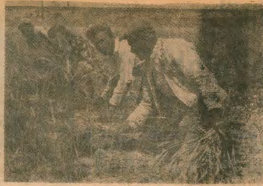
Elleriyle ekin toplayan proleterler