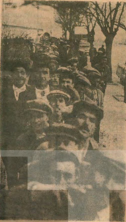
HAFTALIKLARINI ALAN PROLETERLER — Yaşamak bir ağaç gibi tek ve hür ve bir orman gibi kardeşesine

Altı ay kış Altı ay yazdır Köylüye bu toprak hem de çok azdır İşsiz kalmış vatandaş boş yere gez dur Secin İŞÇİ Partisini ey Şark kesini Neymiş var neymiz yok bilmiyormusunuz ? Karnımız acdır demiyormusunuz Bir REFORM bu yere istemiyor musunuz Secin İŞÇİ PARTİSİNİ ey Şark kesini Yeter artık Can gırtlığa dayandı Emekçi, Köylü Gardeş hepsi birden uyandı Çalışacağız baş başa çünkü içimizden geldi Secin İŞÇİ PARTİSİNİ ey Şark kesini Kahramanımız, Gaziyiz biliniyor Fakat bu acı çileler neden oluyor? Yüksek Meclistekiler hergün oyaltıyor Secin İŞÇİ PARTİSİNİ ey Şark kesini SALİH TOPCU İşsiz İŞÇİ