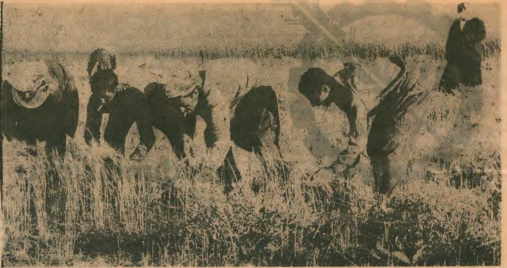
TİRE KÜYLERİNDEN İRGATLAR — İktidar toprak dağıtıyor. İrgatlar gene ırgat kalacak.

Tartışmalar oldukça uzun sürdü. Sağa, sola dânişildi. İlanlanmış olan buğdayların hayvanlardan sonra ilaç olarak insanlara yeniden geçebileceği öne sürüldü ve bu ilaçlama işi şimdilik durdu.