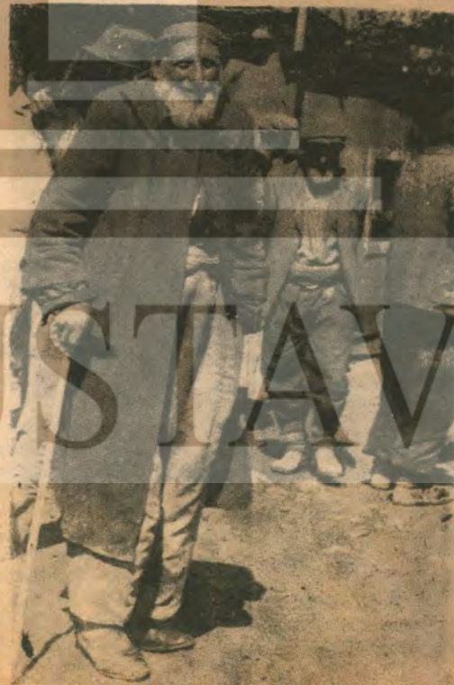
Toprağın olsun dey bekleye bekleye sakalların ağaracak