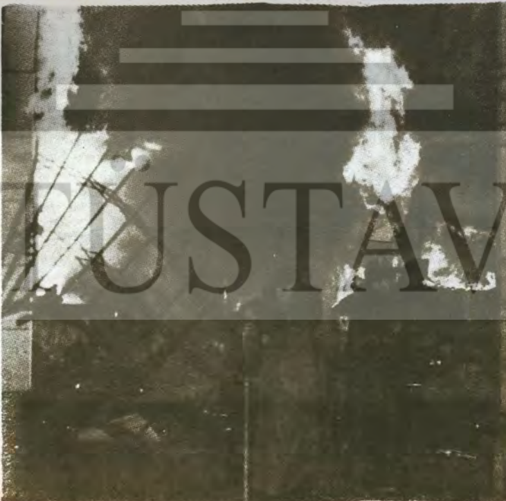
Amerika'daki zenciler, liderleri Martin Luther King'in öldürülmesi üzerine 110 şehirde ayak-

Nisan'a bağlayan gece yaptığı ağlamaklı konuşmasında adaylığını koymayacağını açıkladı. Johnson'un bu kararı yenilgisini kendisinin de kabul ettiği-