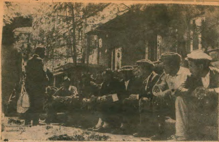
İş ve İşçi Bulma Kurumu önünde Alamanya'ya gitmek için bekleyenler.