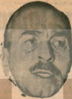
M. A. AYBAR — Tip Genel Başkanı —

nel provası niteliğini taşımaktadır. AP iktidarı, bu haksız ve anti-demokratik yeni Seçim Kanunu ile Senato seçimlerinde umduğu başarıyı sağlayacak olursa, bu, kendisine derhal büyük seçimlere git-