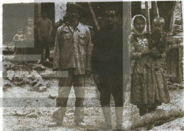
Türk köylüsü, Türk İşçisi, Türk Kadını.