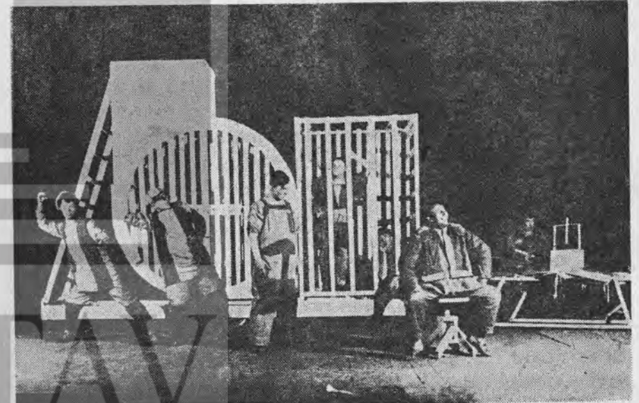
Meyerhold «Tarelkin'in Ölümü» Dekor ve kostüm: Vorvoro Stefanovo

Bu dönemde ressam ve şairlerin toplandıkları bir kahve vardı: