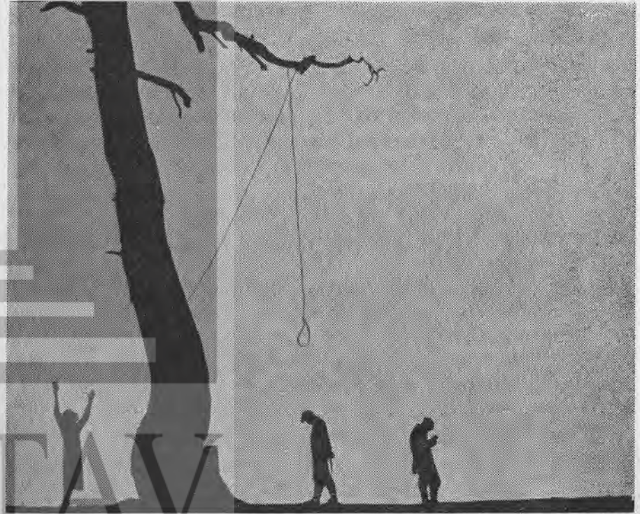
Lev Kuleşov'un «Mahkemedan Sonra» (1926) filminden bir kare

27 Ağustos 1919 tarihli karar sosyalist bir sinemanın yasal temelini oluşturdu. Sovyet filmciliğinin bundan sonraki gelişimine temel oldu ve bu gelişimin yönünü gösterdi. Lenin, «Sovyet gerçekliğini yansıtan, komünist düşüncelerle dolu yeni filmlerin yapımına haber filmleriyle başlamak gerekir,» diyordu. Sovyet sineması gerçekten de haftalık haber filmleriyle başladı. Genç Sovyet devletinin yaşamı filme alınıp perdeye yansıtıldı: Kızıl Ordu'nun Beyaz Muhafızlara ve yabancı saldırganlara karşı giriştiği yiğit savaş, cephe gerisindeki yaşam, kültürel ve politik olaylar, ajit-prop trenleri... Bu filmler nitelikleri bakımından, Gaumont, Pathé ve Pegasus gibi firmaların yaptıkları haber filmlerinden tamamen farklıydı. Burjuva haber filmlerinin kamermanları olayların dıştan bakan seyircisi olmaya özel önem veriyorlardı. Anti-sovyet propaganda bu «nesnel bakış» maskesi ardına gizleniyordu. Cephede ve cephe gerisindeki Sovyet kame-