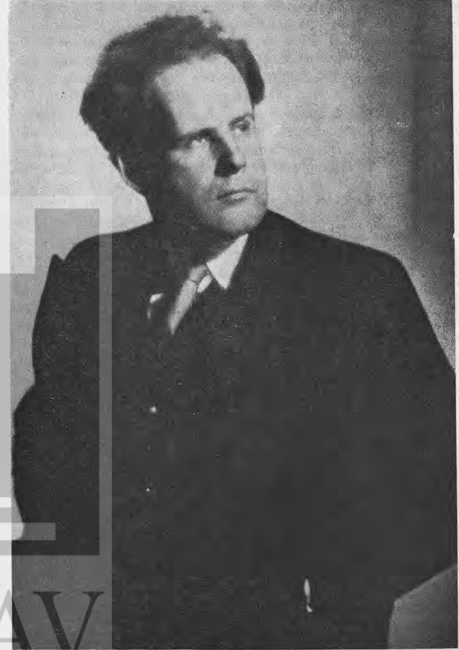
Sergey Eisenstein (1898-1948)

kargaşasında ve tüm eylemlerinde, sosyalizmin çıkarlarına hizmet doğrultusunda son derece içten bir siyasal bağlanma sezilmekteydi. Devrim öncesi Rus Sinemasından şiddetle nefret edi-