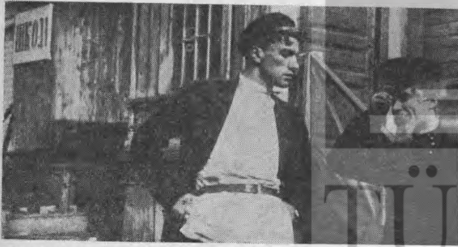
J. Slavinski'nin «Genç Kız ve Serseri» (1918) filminde Vladimir Mayakovski

Sovyet sineması, konulu film alanında ise ilk adımlarını, o sıralar, «Agitki» adı verilen kısa propaganda filmleriyle attı. Bunlar, aslında son derece kısa, afiş yalınlığında, günün siyasal istemlerini seyirciye götüren filmlerdi. Çoğu kez sanatsal bakım-