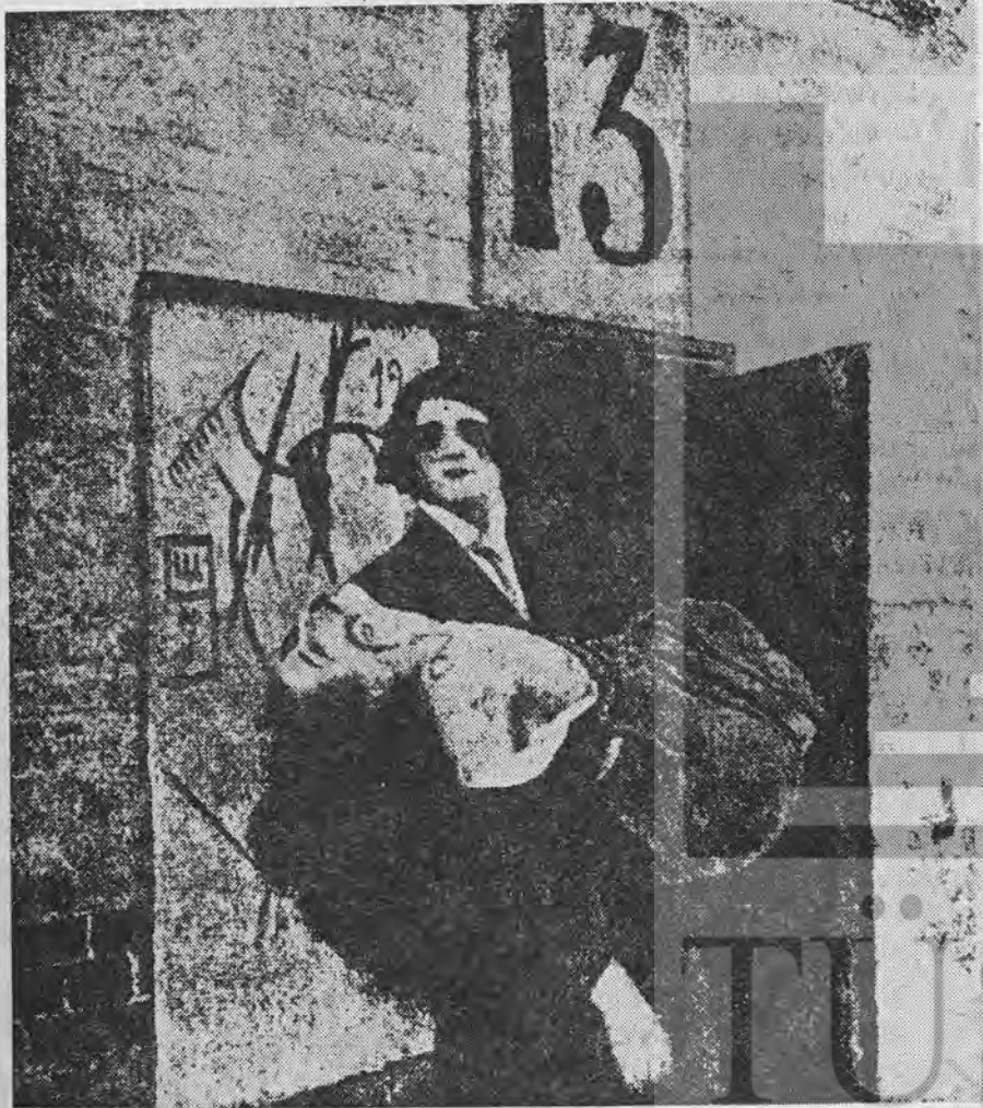
«13 Numaralı Kabarede Dram» adlı filmde Gonçarova ve David Burliuk

«Sanat yapıtı deyimini kaldırıp yerine İŞ kelimesini koymamıza rağmen, gösteriler sırasında kemikli parmaklarıyla (kendi-