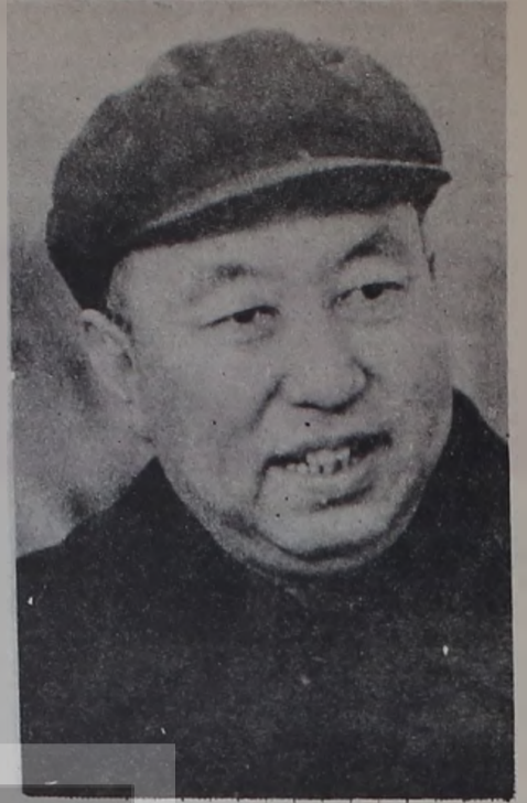
Çin'in yeni lideri: Hua Kuo-feng

Kültür devriminin gerçek hedeflerine ulaşmadan durdurulması ise, iki yönde tavizler vermeye zorunlu hale getirmişti. Bir kere ordu, güvenliği, istikrarı ve sosyal barışı sağlayacak tek etkin örgüt