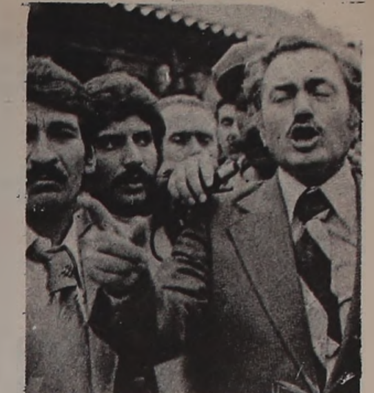
uygulamadığı "tabanın söz ve karar sahibi olması temel ilkesi"nin ardına sığınarak.

Devrimci sendikacılık zor iş. Çünkü devrimci sendikacılık yapmak için her şeyden önce devrimci olmak gerekir. Devrimcilik ise zo: zanaat. Devrimci olmanın bir sürü koşulu var. Ama en baş koşulu; "tavşana kaç, taziye tut" zihniyetine sahip olmamak. Devrimci sendikacılığın baş koşulu, tabana inanmak ve sadece demec verirken değil ama eylem yaparken de tabana birlikte sorumluluğu yüklemek. Yoksa en önemli eylemi koyarken, tabanın söz ve karar hakkına sahip olması ilkesini hatırlayarak işin içinden sıyrılmak değil.