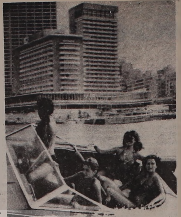
BEYRUT : Kıyıda yaz eğlenceleri

(1) Bu yetkililer ve Parlamento düzeni şu şekilde ayrımlandı: Cumhurbaşkanı ve genelkurmay başkanı Hristiyanlara, Başbakanlık görevi Sünni Müslümanlara, meclis başkanlığı ise Şii Müslümanlara verildi. Son iç savaştan önce parlamentonun durumu şöyle idi: 30 Maruni (Hristiyan), 20 Sünni (Müslüman), 19 Şii (Müslüman) 11 Rum Ortadoks, 6 Rum Katolik, 6 Dürzi, 4 Ermeni Ortadoks, 1 Ermeni Katolik, 1 Protestan.