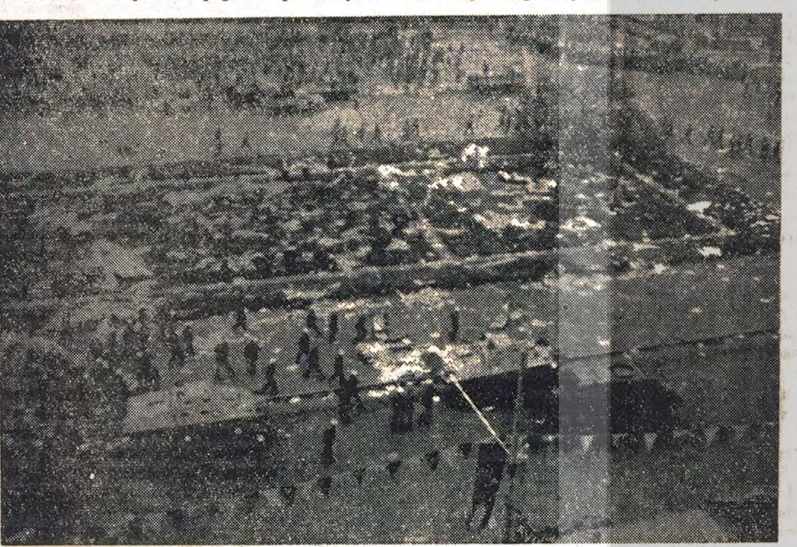
· (1 MAYIS 1977: PROVOKASYON'DAN SONRA TAKSİM ALANI)

düzenleyenlerin nereden güç alıyor olabileceklerine, nereden kaynaklanıyor olabileceklerine dair, bazı kuşkular vardı. (...) Bu Kuşkularım, Başba-BÎRLÎĞÎ ise ortak olarak yayınladıkları bildiride kanlığım zamanında edinmiş olduğum bazı bilgilere sı Amerikan (PARA-CASUS-ORDU) üçüzü dışında Mayıs Katliamını «CIA provokasyonu «olarak ni- de geniş ölçüde dayanıyordu. Bunları, o bilgilerin niteliği bakımından bütün açıklığı ile söyleme hak-