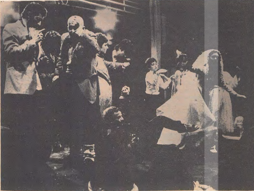
DUGÜN/DAYUL'dan bir görüntü

den geçirirken, sadece birkaç fotoğraf, bize yabancı bir rejimin tanıtım ve direktiflerini buluyoruz. Belki buna, Vakhtangov tarafından "Dibbuk"ta kullanılan "törensel jestus"tan çöplendiklerimizi de katabiliriz. Son olarak "Asyatik" kavramı üstündeki son egzotik şaşaa örtüsünü de kaldırmak için, Münih'li komik, Karl Valentin'in "düşük kaliteli" gösterilerinden söz etmek gerekir. Eğer hiç dinlerseniz, Karl Valentin'in gösterilerinde "Asyatik" birşeyler vardır.