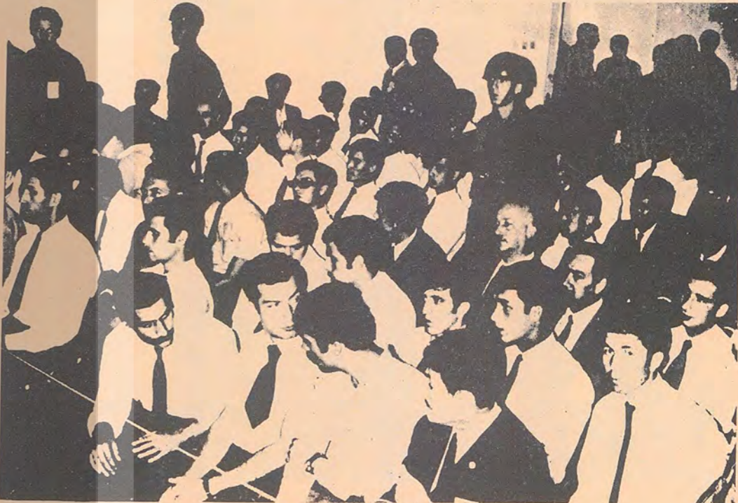
83 Sanıklı Davadan bir görüntü (1971)

"TÜRKİYE HALKI, SENDEN YANA OLANLARI VURANLARA ARTIK YETER DİYORUZ. KATİLLER, YÜREKLERİMİZDEKİ ATEŞ, TÜFEKLERİMİZDEKİ MERMİ,