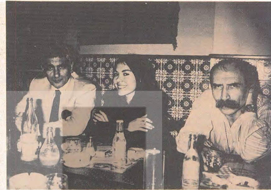
Yılmaz Güney, Ayşe Emel, Tuncel Kurtiz (Cannes Film Festivali)

"Nasıl esnaf loncaları, asker ocağı ve dinsel kuruluşlar arasında sımsıkı bir ilişki bulunuyorsa, seyyirlik oyunların da bu kurumlara sıkı devami 8. sayfada