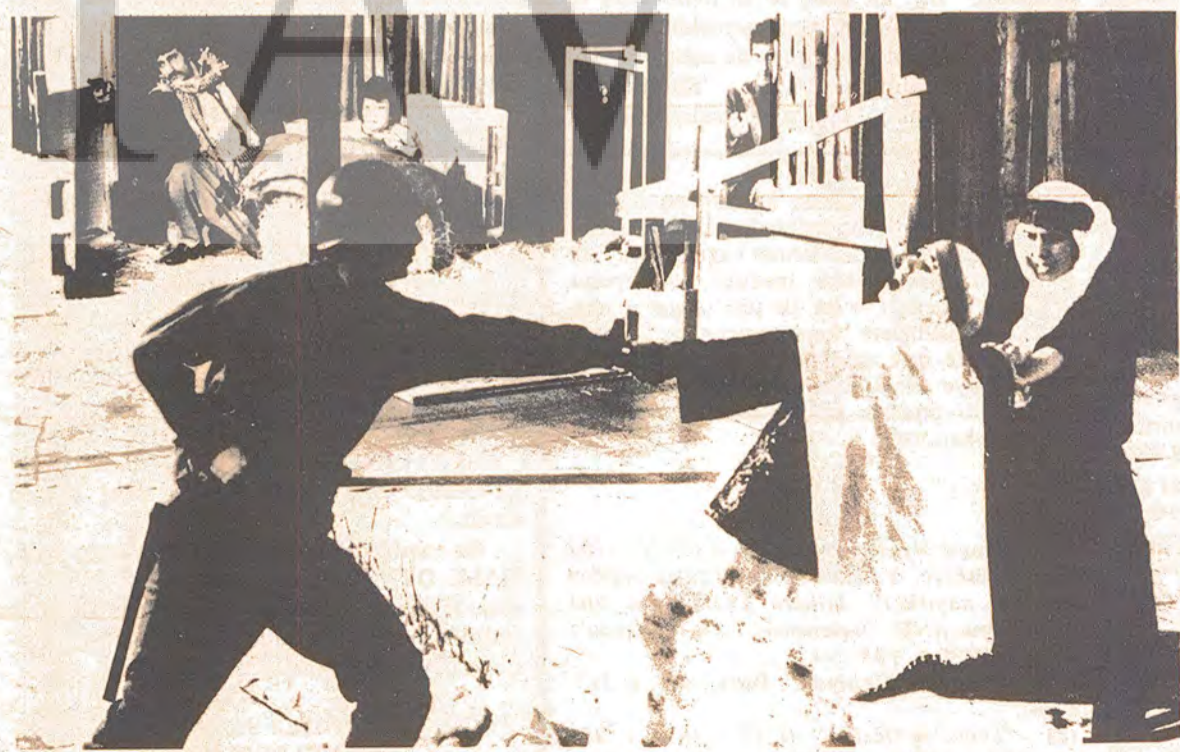
NEWROZ ÇIÇEKLERI'nden bir görüntü