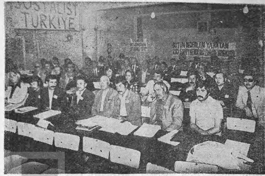
SP'nin kurucular toplantısından bir an

araçlarını, ulaşım ve kredi araçlarını kamulaştıracaktır. Gerçek anlamda ve yurt düzeyinde aynı zamanda uygulanacak olan bir toprak reformu yapacağız. Eğitimde, sağlık işlerinde, sosyal güvenlik alanında emekçiler için köklü dönüşümler yapacağız. Sosyalist Parti, işçilerin, köylülerin, kol emekçilerin yönetiminde olduğundan aslında bu dönüşümleri emekçiler kendileri yapacaklardır. Böylece halkın, halk için, halk tarafından yönetilmesi demek olan demokrasi, ilk kez gerçekten Sosyalist Partinin iktidarında gerçekleşecektir.