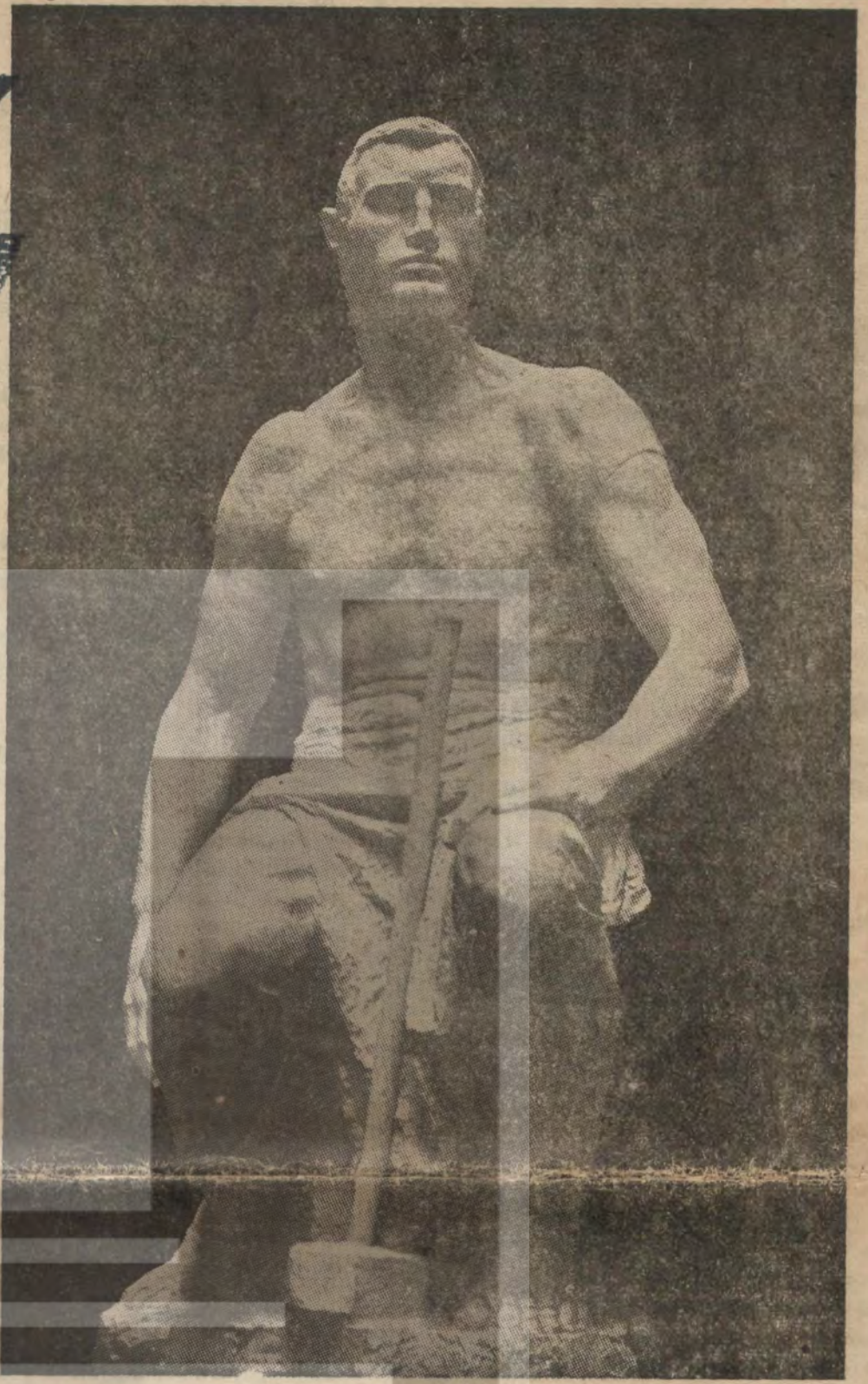
Constantin Meunier'den: İşçi

Gazete ve dergi çıkaranların tahsil seviyelerine ait kayıtlar da aynı şekilde basın hayatının daralmasına, bazı aydın zümrelerin elinde kalmasına sebep olur. Gazete ve dergi yayınlamak hakkı neden sadece üniversite mezunu vatandaşlara tanınsın? Demokrasinin gerektirdiği basın hayatı, sadece aydınların yayınlarda bulunmasından ibaret değildir; daha ziyade, halkın da kendi sesini kendi dilhyle, kendi görüşü ve