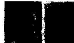
Nezihe Demirkent, Oktay Ekşi

ye'de muhalif basın kalmadı ve basını eleştiri haklarından tümüyle vazgeçti. Türk basını şimdiye kadar bayyaz veya siyah yazarları kanıyla hükümet politikasına kabulma dönemini de geride bırakarak doğrudan doğruya sayfa düzenleyicileri ve haberlerle devlet politikasını sürdürme aracı oldu. Eylül darbesine kadar bir genel eğilim olarak Türk basını, bayyazları ve siyah yazarları dışında yorum