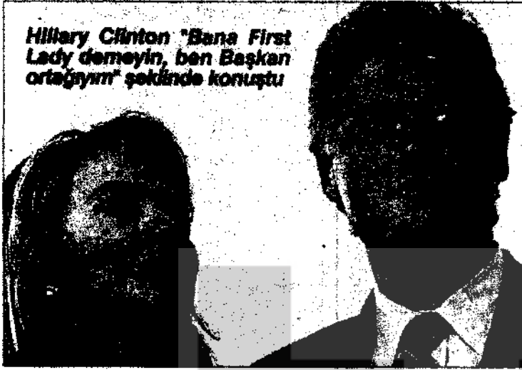
Hillary Clinton "Bana First Lady demeyin, ben Başkan ortağım" şeklinde konuştu

Rusya gelmek üzeredir. Sovyetler'in yerine Rusya'nın gelmesi, Amerika'nın uzun dönem çıkarlarına uygun mudur? Artık dünya ölçüsünde bir tehdit olmaktan vazgeçmiş bir Sovyetler mi, yoksa diğer tekelli devletlerle rahat ittifaklara girebilecek bir Rusya mı, Amerikan çıkarına uygundur. Sadece kapitalizmi ve tekeller düzenini terbiye eden, bu arada en çok çekindiği Amerika ile ilişkiyi seçen bir Sovyetler mi, yoksa geçiş sıkıntılarını aştıktan sonra Japonya ya da Almanya ile anlaşabilecek büyük bir tekelli Rusya Devleti mi Amerika açısından tercih edilmelidir?