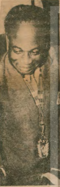
Emperyalizmin son aşaması olan yeni — sömürgeciliğin kurbanlarından N'Krumah