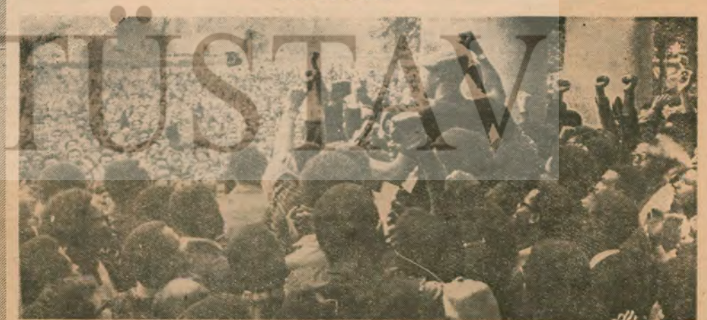
... ve Amerika