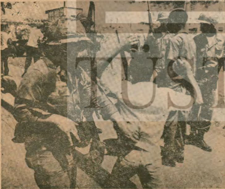
Amerikan askerleri Dominik'te

(Çoğunlukla «L'Americque Brule» adlı kitapta de nlemiştir.)