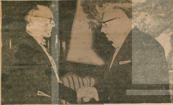
Yeni Amerikan Büyükelçisi Robert W. Komer güven mektubunu Cumhurbaşkanı Cevdet Sunay'a sunduktan sonra

12 Yıl «CIA» da çalışan Komer, Türkiye'ye Amerikan Büyükelçisi olarak gönderildi. (Basından)