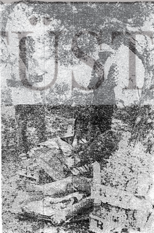
Eylenhoç köyünde üzüm toplayanlar