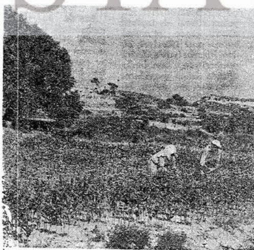
Mordoğan yakınlarında tütünde çalışanlar

Karaburun köylerindeki domuz dünyanın bir yerinde yokmuş. Üzümleri yiyip bitiriyormuş yaban domuzları. Domuz kurşunu götürene de, bir domuz kurşunu veriyorlardı. Kadar.