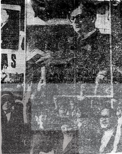
Umurbaskanı Lleras için yapılan bir eğitim toplantısı.

Bes hafta sonra, 15 Şubat 1966 da, Camillo Torres, ordu ile bir çatışma sonucunda ölü bulundu. Bir başka gerilla öcağı, 1967 yılında «Ordo» binin Haut — Simu yöresinde yuvalandı; bu yöre Pasifik Okyanusuna yakındır. Bir bölgedir. Daha 1967