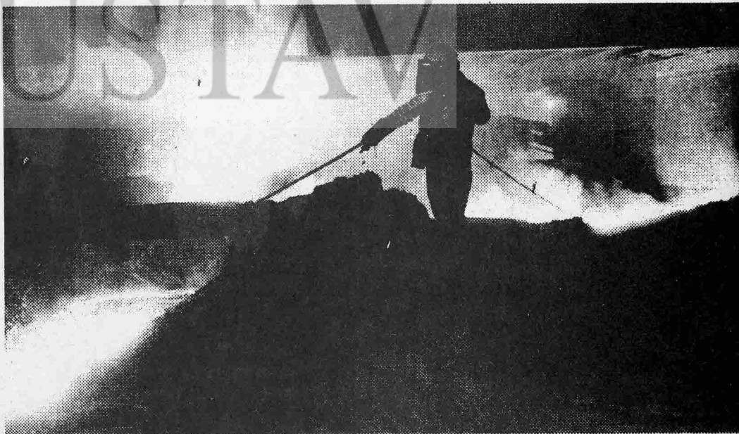
Çelik işletmesinin fırınlarında zor koşullar altında çalışılır.

Yeni yıldan 1 hafta önce Thyssen tekeli yırsal işten çıkarmaları onayladı. Duisburg-Hamborn işletmesinde yapılan bir personel toplantısında belirtildiğine göre yeni yılda 34 000 olan şimdiki çalışan sayısı yüzde beş azaltılacak. Bununla birlikte Duisburg'da yok edilen işyerlerine 1700 daha ekleniyor. Thyssen aylık çelik üretimini de 1,2 milyon tondan 800 000 tona düşürüyor.