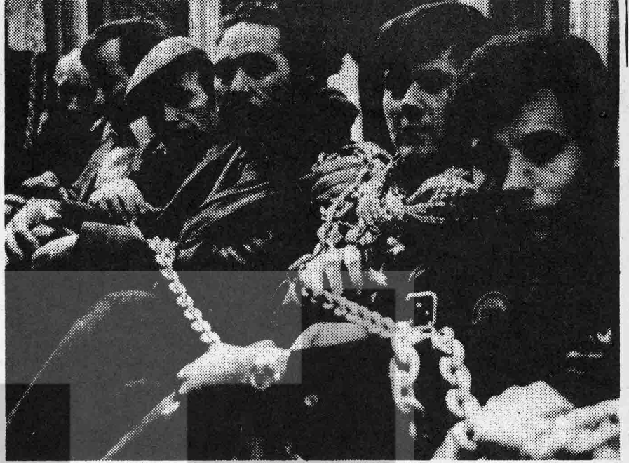
Kassel'de Enka işçileri yerli yabancı işçilerin ortak direnişlerinin en güzel örneklerini verdiler.