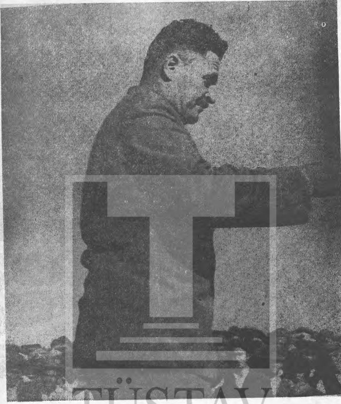
NÂZİM HİKMET, 1951 yılında Bulgaristan'ın Deliorman bölgesinde Kemaller kentinde Türk halkı arasında