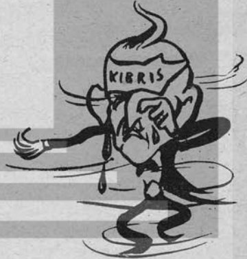
MASAL BAŞINI BAĞLAMIS DÖNE DÖNE AĞLAMIS ....

Darağacı çiçek açmaz Onun payandası Dolar, Tâviz veren gafil en az Kanıyla kökünü sular.