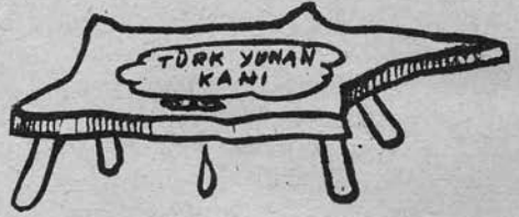
MASAL MASAL MASA YAŞ