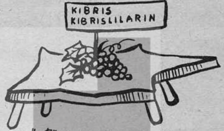
ÜSTÜNDEKİ YENMEZ YAŞ

İyi bakın arkadaşlar İşte intikam aleti, Böyle bir A ile başlar AP- cinin adaleti.