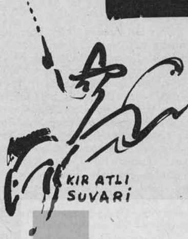
KIR ATLI SUVARI