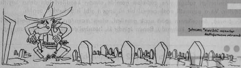
Yolcu: "Kurtuluş mücadelesi destanımızın mirasidir."

Taksim Alanı'ndaki çağrı, bugünkü anti-emperyalist ve anti-feodal ve kompradorlara karşı savaşımızda bir düğüm noktasıdır. Emperyalistler ve Demirelciler, bütün anti-emperyalist, demokratik ve reformcu güçlerin bir araya gelmemesi ve bir cephe politikası yürütememesi için olağanüstü çabalar ve milyonlar harcıyorlar. Ama emperyalizme ve onun yerli ortaklarına karşı bir cephe politikası ile savaş fikri, her şeye rağmen, ilerliyor. Çünkü hayat bunu zorluyor; çünkü emperyalizmi başımızdan atmanın, milli-demokratik bir hükümet kurmanın, demokrasiyi geliştirme ve reformları sağlamanın çaresi bugünkü şartlar altında budur.