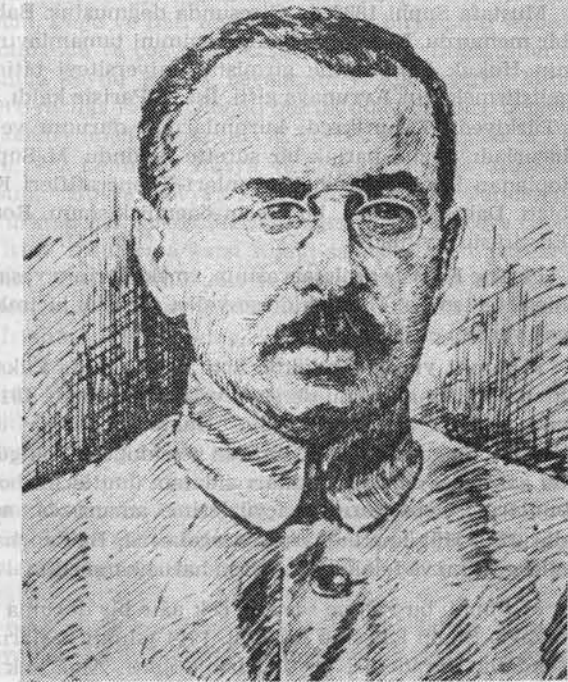
TKP-nin kurucusu Mustafa Suphi 1882-1921

TKP, 50 yıl boyunca olağanüstü zorluklarla karşılaştı. Faaliyetinin zaman zaman aksadığı oldu, fakat yaşama gücünü hiçbir zaman kaybetmedi. Çünkü bu güç Türkiye proletaryası, Türk emekçileri gibi sınırsız bir kaynaktan geliyor. Bu kaynağın kudretine olan inanç, Marksizme-Leninizme, proletarya enternasyonalizmine bağlılık, sosyalizm ve komünizm yolunda elde edilen büyük başarılar, milli kurtuluş hareketlerindeki hamleler, dünya komünist hareketindeki birliğin gücü Türk komünistlerinin inanç ve iradelerini beslemekte, kuvvetlendirmektedir. Dünya komünist hareketinde birlik ve dayanışma, bu bakımdan, Türk komünistleri için ayrı bir değer, ayrı bir önem taşıyor. Bu birliğin korunmasına, kuvvetlendirilmesine çalışmak, enternasyonal bir vazife olduğu kadar, Türk emekçilerinin sınıf menfaatlerinin de gerekli kaldığı bir vazifedir. Türkiye Komünist Partisi, milletlerarası komünist hareketinde birliğin Marksizm-Leninizm prensiplerine göre, komünist ve işçi partileri temsilcilerininin 1957 ve 1960 Moskova kararları temeli üzerinde kuvvetlendirilmesi için gayretlerine devam etmektedir.