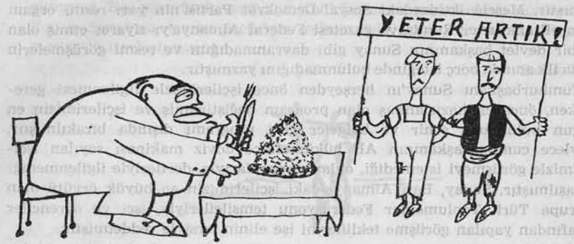
EMEÇİLER DAVALARINA SAHİP ÇIKIYORLAR.

THY'nin bu 120 kişilik uçağı Batı Almanyadan geliyordu. Özel bir seferden dönen uçakta Cumhurbaşkanı Sunay ve 49 kişilik hükümet heyeti bu-