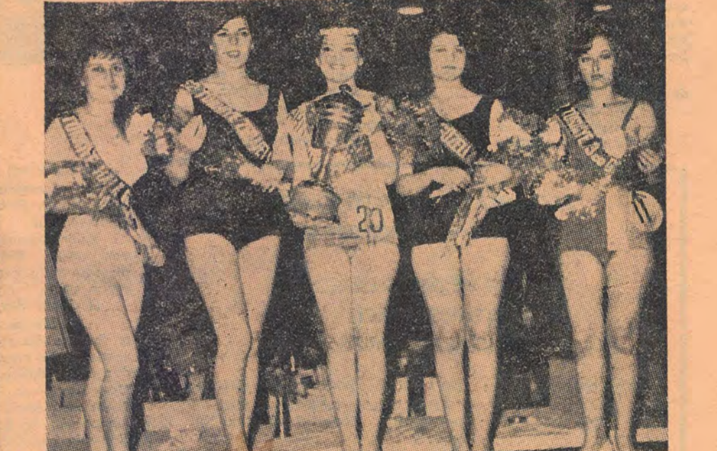
KALÇALARI GÜZELLER — Bir yandan hafız kızlar yetiş tirilirken bir yandan da düzenlenen güzelik yarışmalarında kızlarımızın göğüsleri, baldırları, bacakları, gerdanları, sırtları, kalçaları ölçüye, tartıya vurularak, en bi çimlisi en göz doldurana en ölçüülü: Güzelik kraliçesi seçilir. Kapitalist düze nin ya da kokuşmuş, bozuk, düzensiz toplumların en göze batan iki belirtisi var dır: Boks mağları ve güzelik yarışmaları... Bunların ikisi de insanın daha hayvan sı zamanlarından içinde kalmış ilkel coşkularını kamçılama için yapılır.

Bu gericilere ve bugünkü yönetmenlere hatırlatalım: Bugünkü Atatürk Tür kyesinde (!) her çocuğun ilkököl öğrenimini yapması kanuna göre zorunluktur. Çocuğunu ilkökula göndermeyen babadan önce para cezası alınır, sonra da o baba hapise atılır. Bu hafız kızlar ilkökula gitmişler midir? İstanbul'da hafız kızlar yetiş çocuklarının ilkökula gidip gitmediklerini neden sormuyorlar? Hey gidi Atatürkçü lük!