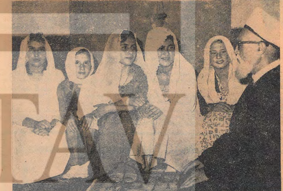
HAFIZ KIZLAR — Yukarıda gördüğünüz resim gibi birçok resim ler gazetelerin birinci sayfalarında sık sık görmeye başlamıştır. Sonra da hiç utanmadan, hiç sıklımadan yurdumuzdaki bütün partilerin ileri gelenleri, kendi lerinin ve partilerinin Atatürkçü ve Atatürk'ün yolunda olduklarını söylerken yüzleri de kızarmıyor. Pekiy, Atatürkçüdürler, Atatürk'ün yolundadırlar da, neden Atatürk'ün sağlığında kız hafızların resimleri hiç gazetede çıkmadı? Şu yukarıdaki gibi bir tek resim Atatürk zamanında gazetelerde gördünüz mü? Yillardan beri Türkiye'de her türlü gericiyle yayınlar, öyle bir gerici ortam, öyle bir gericiilik piyasası kurmuşlardır ki, kazançtan, ceplerini doldurmaktan başka bir şey düşün meyen birtakım gazeteler de gerici piyasaya böyle resimlerle süslü gazeteleri son günlerde çokça sürmeye başlamışlardır.

İŞTE TÜRKİYE: SPOR – TOTO, MİLLİ PİYANGO, AT YARIŞLARI, SAM AMCA, BANKA İKRAMİYELERİ, LOTARYACI BASIN, YÜKSEK SOSYETE KULÜPLERİ, KAHVEHANELER, BUL KARAYI AL PARAYI, HAFIZ KIZLAR VE GÜZELLİK YARIŞMALARINI, VE «BİZ KİMLE RİZ, BİZ ALTAY'DAN GELEN ERLERİZ!»