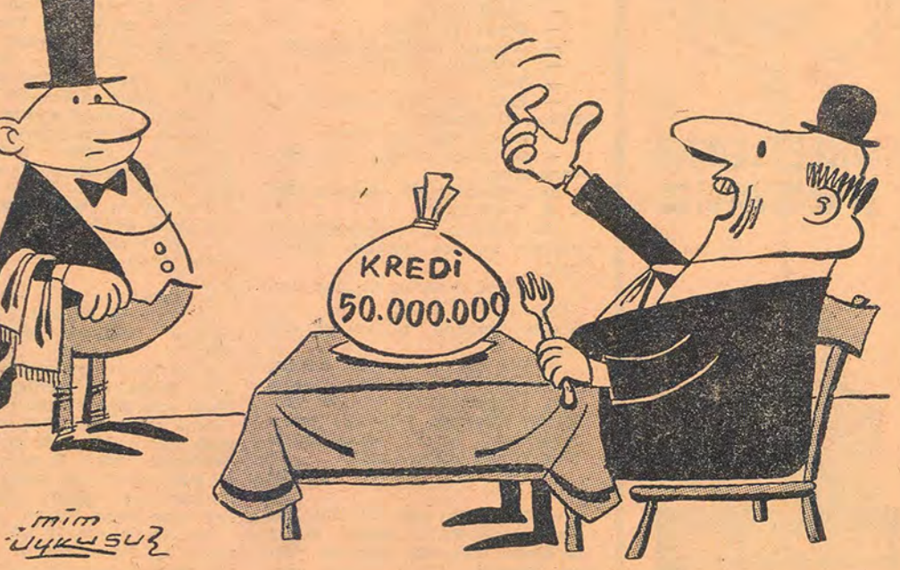
- Bir porsiyon daha!..