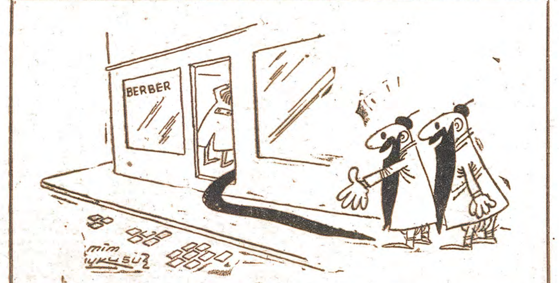
— Ooo... Efendi hazretleri gene saçraştı oluyor!...